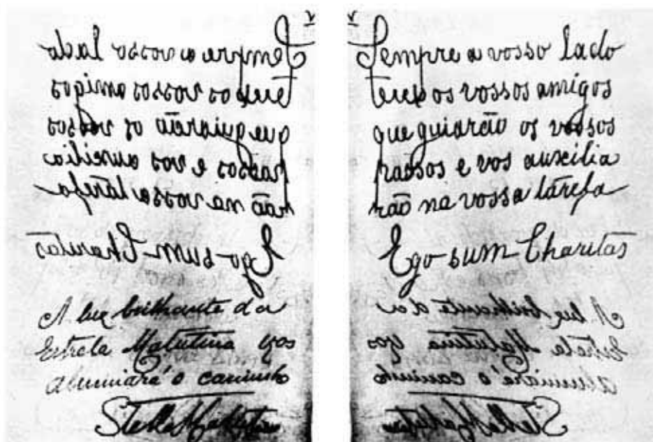
Figura 1. Facsímil de parte del mensaje recibido en Lisboa el 7 de febrero de 1917 mediante la “escritura automática” (de Furtado de Mendonça).

Un examen del escrito muestra que este no es un mensaje anónimo del alma de algún “muerto” no identificado. La firma, “Stella Matutina”, es de hecho muy grandilocuente. ¿Quién es Stella Matutina? Durante siglos, la “Estrella de la mañana” o “Stella Matutina” en latín ha hecho referencia al planeta Venus, a una diosa madre, así como a la Virgen María .