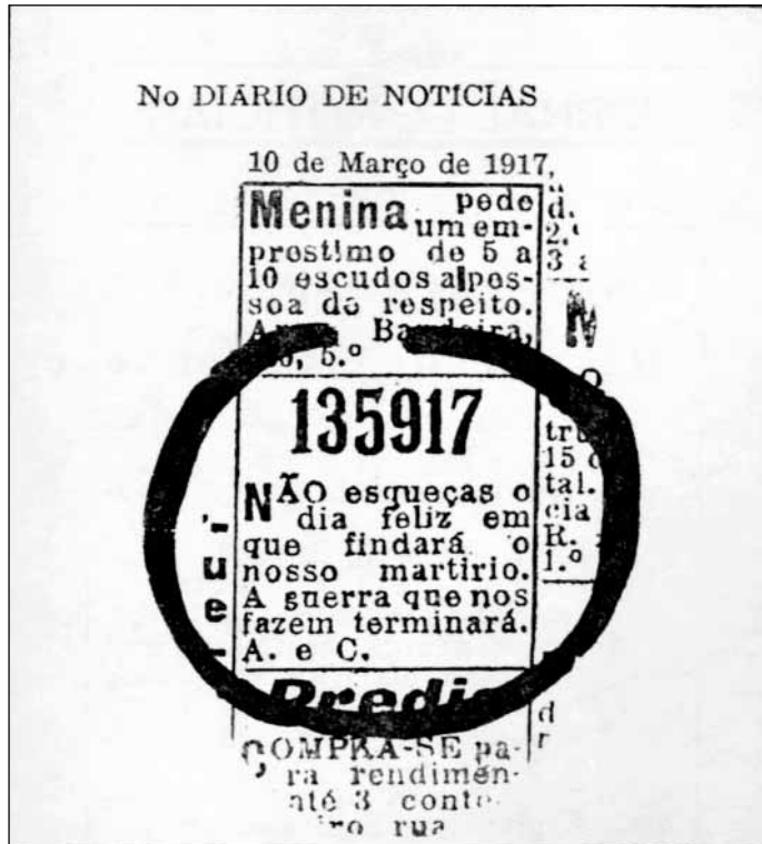
Figura 2. El anuncio codificado matemáticamente que se publicó el 10 de marzo de 1917 en la edición del Diário de Notícias . El titular “135917”, un código matemático para “13 de mayo, 1917”, corresponde a los hechos que sucederían en Fátima dos meses después.