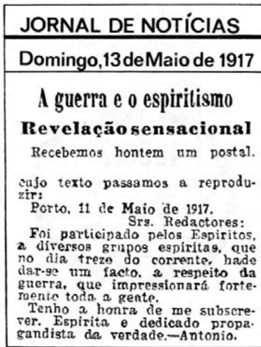
Figura 3. Noticia de prensa que predice los sucesos de Cova de Iria, publicada el día que ocurrieron los hechos, el 13 de mayo de 1917, en el Jornal de Notícias .

El confiado periodista, involuntariamente, había leído algo más del anuncio de lo que confesaba. Además, se revela a sí mismo como un profeta, por derecho propio, ya que añade sus propias palabras, “gran trascendencia y grandes consecuencias” al anuncio, ¡que es lo que, en realidad, llegó a pasar con las apariciones de Fátima!