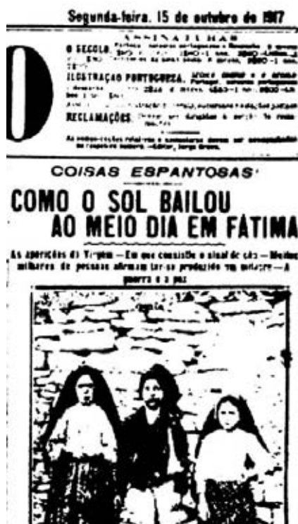
Figura 6. Primera página de O Século , que describe el «Milagro del Sol».

Reflexionemos, pero tengamos siempre en cuenta nuestros propios “prejuicios”.